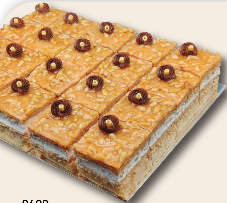
9409 PLANCHA PREMIUM MILHOJAS CON PIÑONES Bizcocho, hojaldre, crema pastelera, nata montada y piñones. 20 porciones 34x26 cm. 1900 g.

Especiales para banquetes y celebraciones