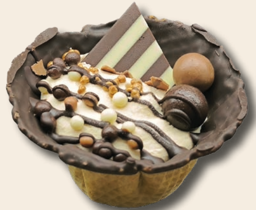
9431 CREPPES NIDO KÍNDER CON CRUJIENTE DE ROCHER

Suave mousse de crema kinder decorado con pallieté de chocolate y macaron, sobre galleta crepe y chocolate. 125 g. 12 unid/caja