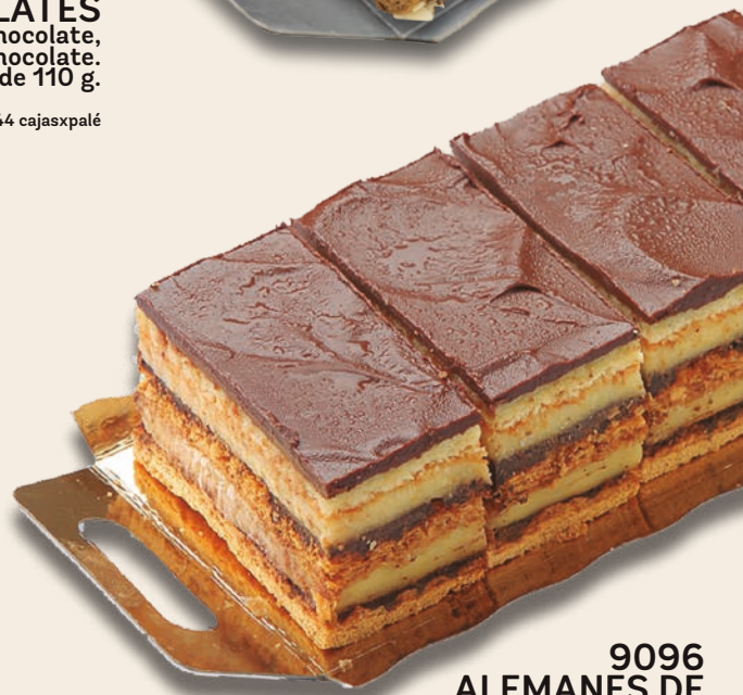
9096 ALEMANES DE CHOCOLATE Bizcocho, crema pastelera, hojaldre y crema de chocolate. 3x5 unidades de 120 g.