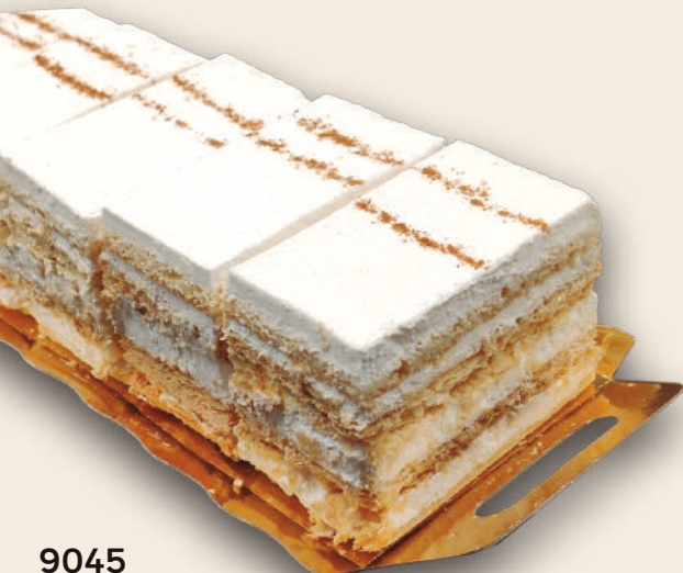
9045 MILHOJAS DE NATA Crujiente hojaldre y nata montada. 3x5 unidades de 110 g.