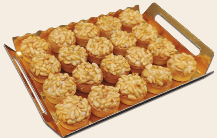
9030 MINITARTALETAS DE PIÑONES 2 bandejas de 20 unidades. Peso aproximado 2x750 g.