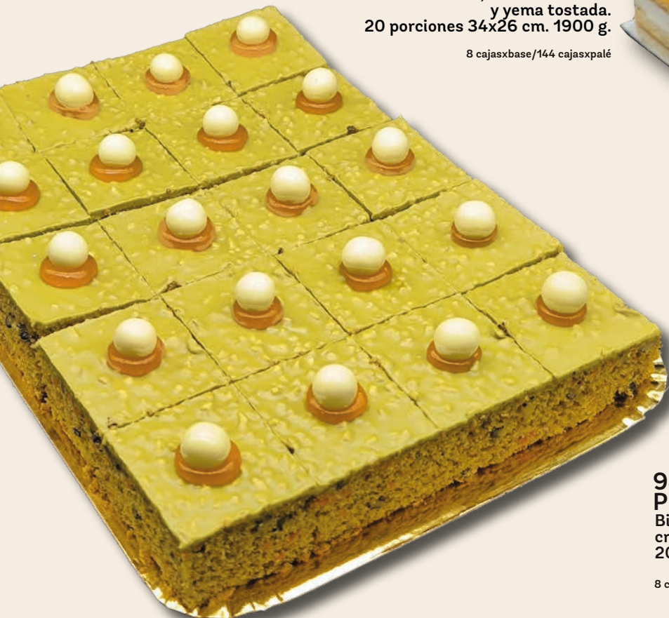
9441 PLANCHA CARROT-PISTACHO Bizcocho de zanahoria con cubierta de cremino de pistacho. 20 porciones de 100 g.