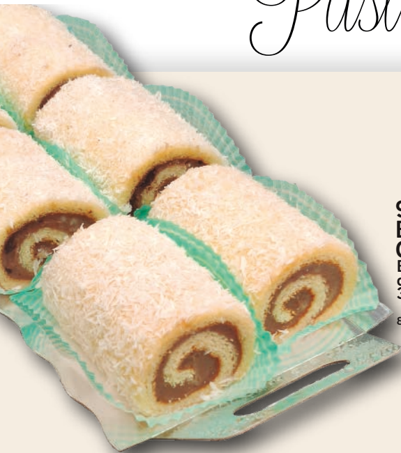
9376 BRACITOS COCO-CHOCO Bizcocho borracho, crema de chocolate y coco rallado. 3x6 unidades de 110 g.