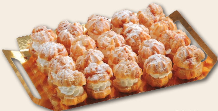
9016 BOCADITOS DE NATA 2 bandejas de 20 unidades. Peso aproximado 2x450 g.