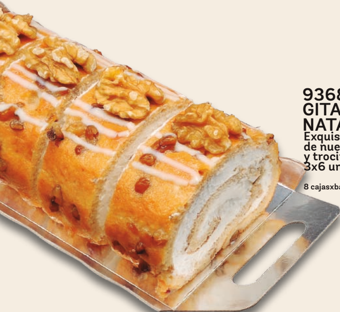
9368 GITANITOS NATA-NUECES Exquisito bizcocho artesano de nueces, nata montada y trocitos de nueces. 3x6 unidades de 110 g.