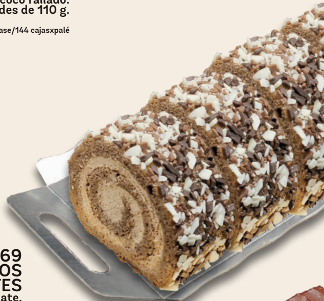
9369 GITANITOS TRES CHOCOLATES Bizcocho artesano de chocolate, trufa y pailleté de chocolate. 3x6 unidades de 110 g.