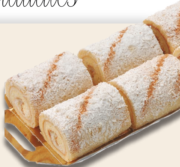
9116 BRACITOS DE CREMA Bizcocho borracho, crema pastelera, azúcar glass y coco rallado. 3x6 unidades de 110 g.