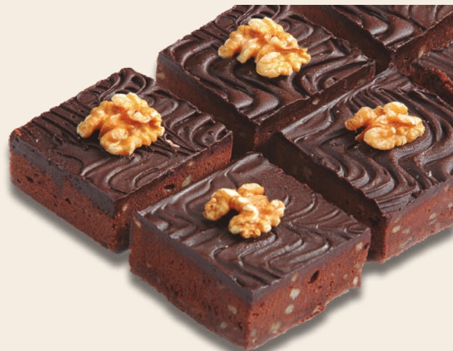
9026 BROWNIE AMERICANO Bizcocho especial de chocolate y mantequilla con trocitos de nueces. 20 unidades de 100 g.