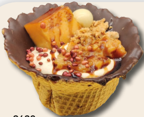
9432 CREPPES NIDO MOUSSE TURRÓN CON TOCINO DE CIELO Mousse de turrón con tocino de cielo y crema de tocino de cielo sobre galleta crepe y chocolate. 125 g. 12 unid/caja