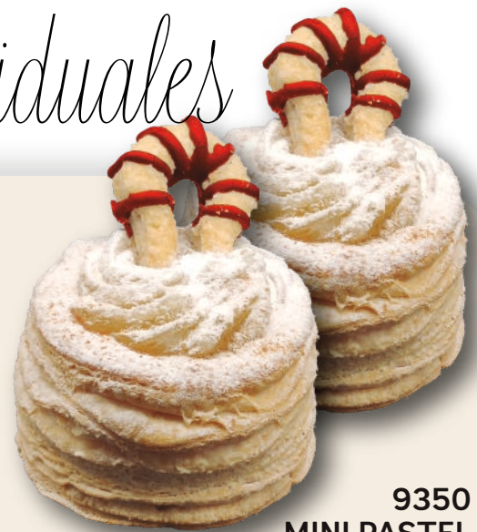
9350 MINI PASTEL CORDOBÉS

Típica especialidad local elaborada con hojaldre y cabello de ángel, decorada con azúcar y filigrana de hojaldre. 15 unidades de 100 g.