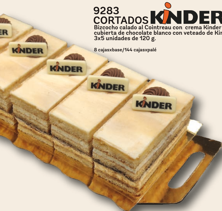
9283 CORTADOS KINDER Bizcocho calado al Cointreau con crema Kinder y cubierta de chocolate blanco con veteado de Kinder. 3x5 unidades de 120 g.