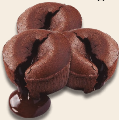
9407 COULANT CHOCOLATE Esponjoso bizcocho de chocolate con chocolate líquido en su interior. 27 unidades de 110 g. Para tomar caliente.