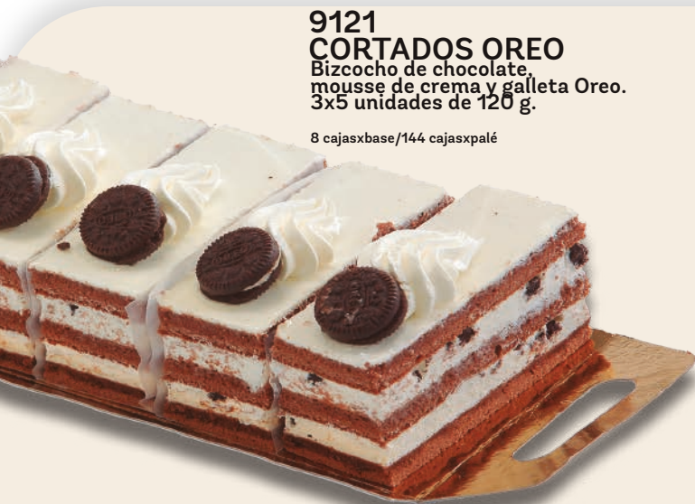
9121 CORTADOS OREO Bizcocho de chocolate, mousse de crema y galleta Oreo. 3x5 unidades de 120 g.