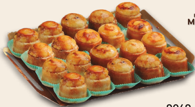
9049 MINIPIONONOS 2 bandejas de 20 unidades. Peso aproximado 2x800 g.