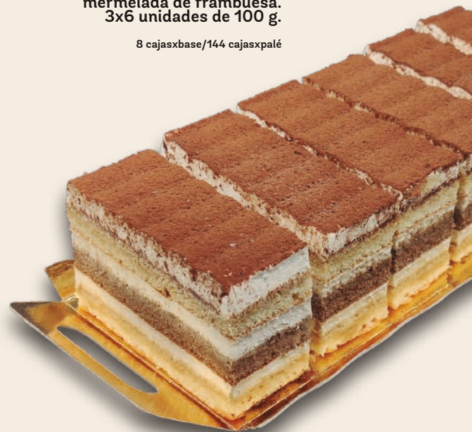
9115 CORTADITOS TIRAMISÚ Bizcocho artesano, crema de tiramisú y cacao. 3x6 unidades de 100 g.