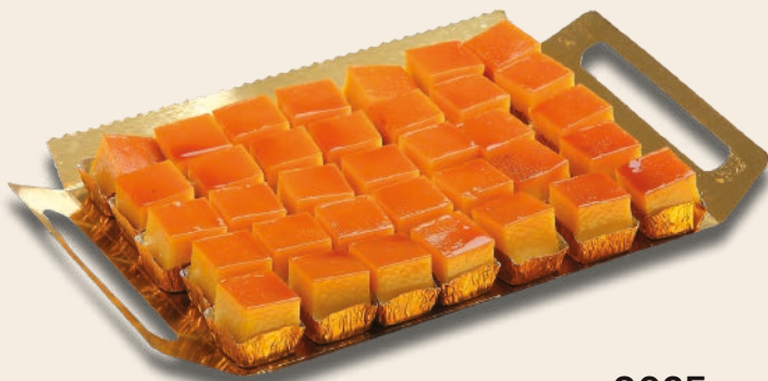
9025 MINITOCINILLOS DE CIELO 2 bandejas de 35 unidades. Peso aproximado 2x800 g.