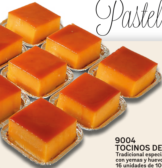
9004 TOCINOS DE CIELO Tradicional especialidad elaborada con yemas y huevos frescos. 16 unidades de 100 g.