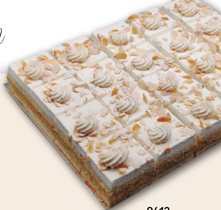
9412 PLANCHA PREMIUM ALMENDRA

Bizcocho de almendra, crema de almendra y nata montada. 20 porciones 34x26 cm. 2500 g