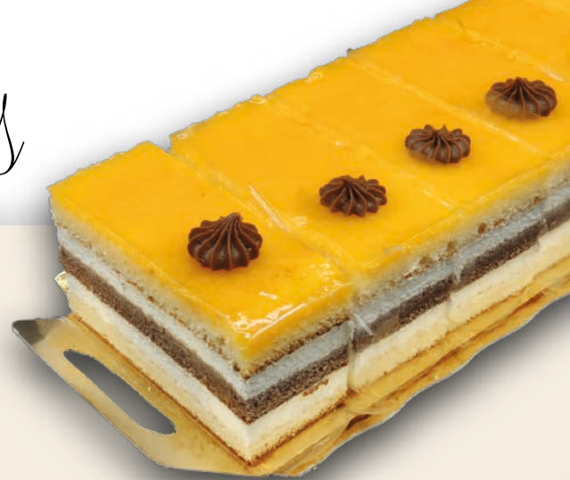
9110 CORTADITOS SAN MARCOS Bizcocho artesano y bizcocho de chocolate, nata montada y yema tostada. 3x6 unidades de 100 g.