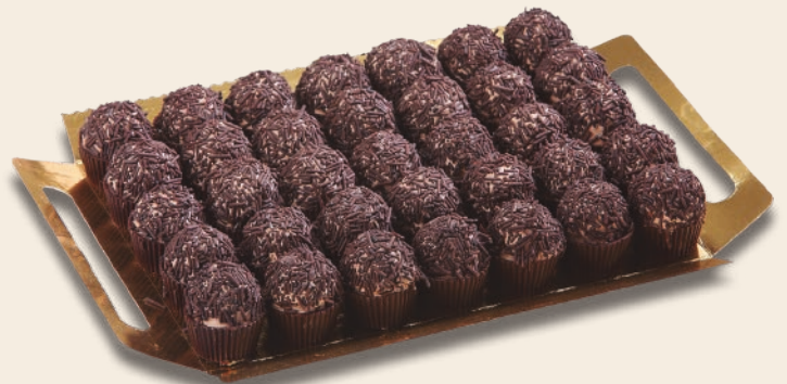
9024 TRUFITAS 2 bandejas de 35 unidades. Peso aproximado 2x750 g.