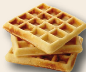
GOFRE 24 unidades de 110 g. Para tomar caliente.