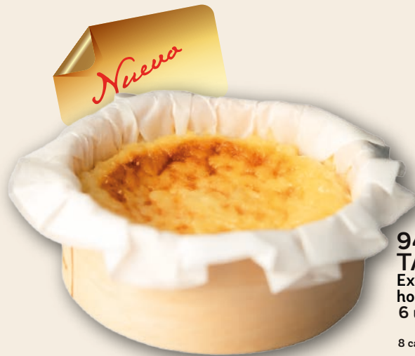
9434 TARTITA DE QUESO MAXI Exquisita masa de queso extracremoso horneada, PARA COMPARTIR. 6 unidades de 220 g.