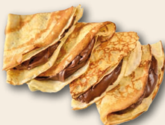
CREPE CHOCOLATE 50 unidades de 110 g. Para tomar caliente.