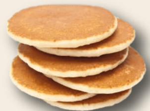
TORTITA AMERICANA 72 unidades de 110 g. Para tomar caliente.