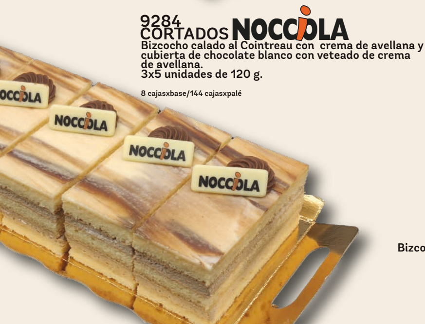
9284 CORTADOS NOCCIOLA Bizcocho calado al Cointreau con crema de avellana y cubierta de chocolate blanco con veteado de crema de avellana. 3x5 unidades de 120 g.