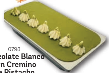
0798 Chocolate Blanco con Cremino de Pistacho