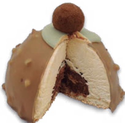
Iglú Latte Nocciola con Crujiente de Gianduja 3005

Bizcocho de chocolate, mousse de chocolate blanco, mousse y crema de chocolate, rematado con bolas de chocolate. 130 ml. 14 unidades/caja.