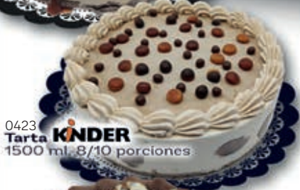
0423 Tarta KINDER 1500 ml. 8/10 porciones