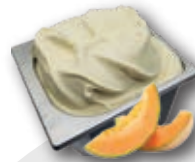
0684 Melón Crema