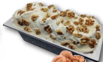
0620 Nata Nueces