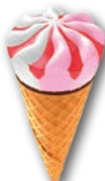
Cono Nata Fresa 24 unidades