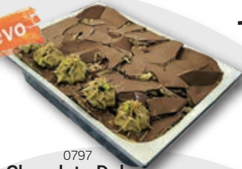
0797 Chocolate Dubai