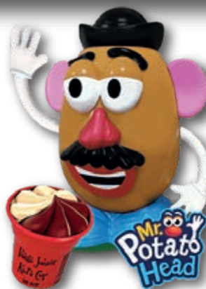
Helado de Vainilla y Chocolate. Figura 3D Mr. Potato 100 ml. 8 unid./caja 0030