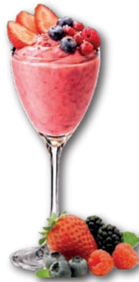
0509 Frutos Rojos