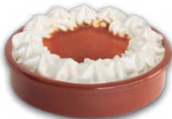
3051 Tarta al Whisky 170 ml. 6 unidades/caja