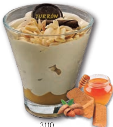
3110 Turrón Suprema con Turrón