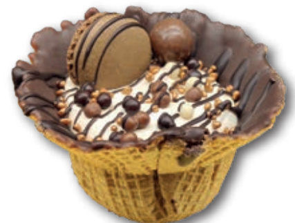
Suave mousse de crema kinder decorado con pallieté de chocolate y chocolatinas, sobre galleta creppe y chocolate. 125g. 12 unidades/caja

CREPPES NIDO KINDER CON CRUJIENTE DE ROCHER 9431