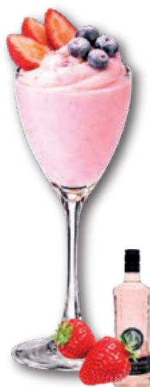
0543 Gin Puerto de Indias