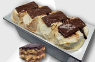
0754 Tarta de la Abuela