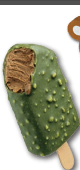
0072 Bombón Luxxus Dubai 16 Unidades