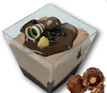
3155 Chocolate ROCHER