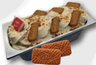
0729 Hecho con Galleta Lotus