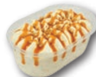
Vasito Menú Premium Nata Nueces 27 unidades