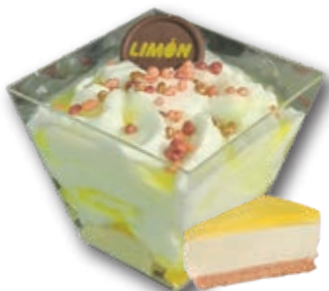
3154 Tarta de Limón al Limoncello