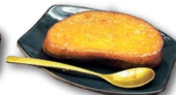
Torrijas Caseras 125 g. 15 Unidades