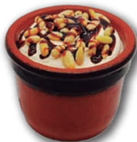
3009 Flan Helado con Piñones 140 ml. 6 unidades/caja