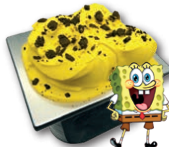
Bob Esponja 2,8 l.