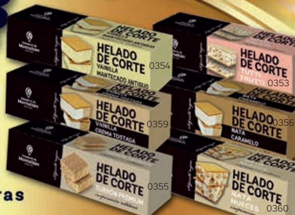
HELADO DE CORTE VANILLA MANTECADO ANTIGUO 0354