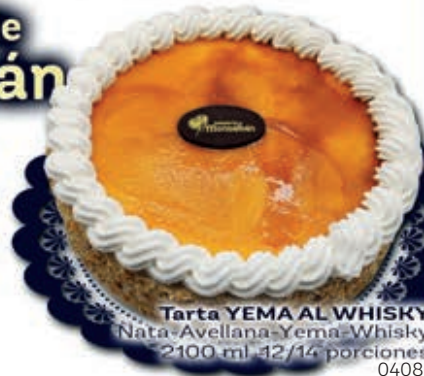
Tarta YEMA AL WHISKY Nata-Avellana-Yema-Whisky 2100 ml. 12/14 porciones 0408