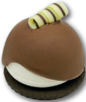
Iglú Midi Tarta de la Abuela 3156 Exquisito helado de vainilla cubierto con crema gianduja. Decorado con caracola de chocolate. 110 ml. 15 unid/Caja