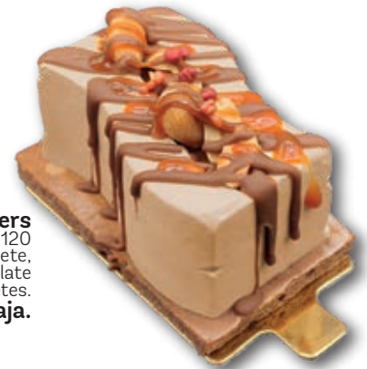
Ondina Snickers 3120 Suave mousse de cacahuete, con crema de chocolate y cacahuetes. 140 ml. 15 unidades/caja.