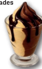
Copa Hostelería Vainilla Chocolate con salsa Nocciola 180 ml