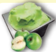
0706 Manzana Verde