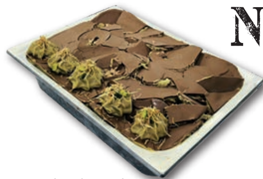
Chocolate Dubai En bandeja ancha de 5,5 litros