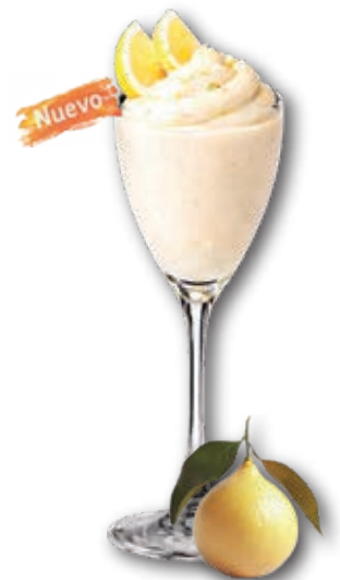
3161 Limón Yuzu