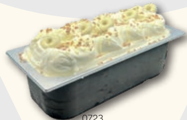
0723 Hecho con Filipinos