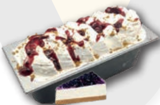
0608 Tarta de Queso con Arándanos