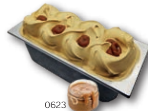
0623 Dulce de Leche