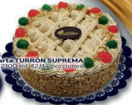
0405 Tarta TURRÓN SUPREMA 2100 ml. 12/14 porciones