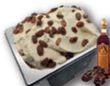
0767 Pedro Ximénez con Pasas