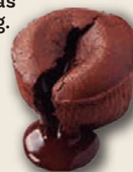
9407 Coulant Chocolate 27 unid./110 g.