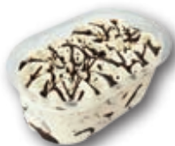
Vasito Menú Premium Stracciatella 27 unidades