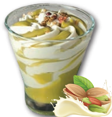
3113 Chocolate Blanco con Cremino de Pistacho