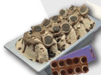
0763 Hecho con Chocolate Milka Oreo