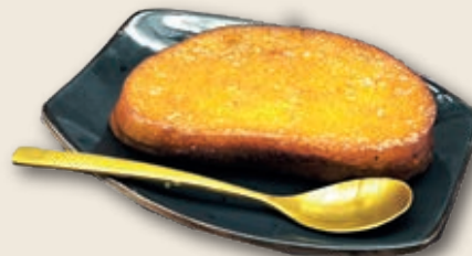
9174 Torrijas Caseras 15 unid./125 g.