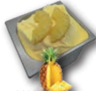
0686 Piña Crema