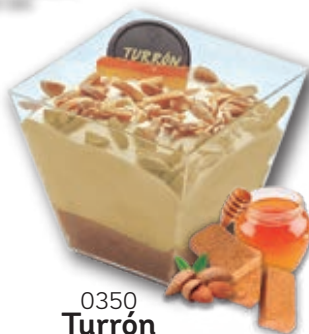
0350 Turrón Suprema con Turrón