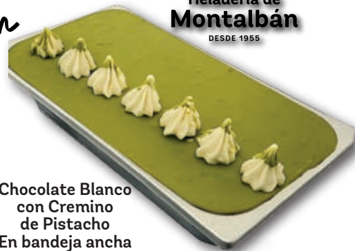
Chocolate Blanco con Cremino de Pistacho En bandeja ancha de 5,5 litros