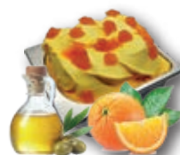
0791 Naranja Con Aceite de Oliva