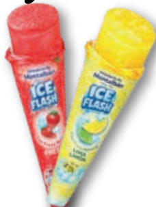
Ice Flash Lima-Limón/Fresa