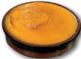
3050 Crema Catalana 170 ml. 6 unidades/caja