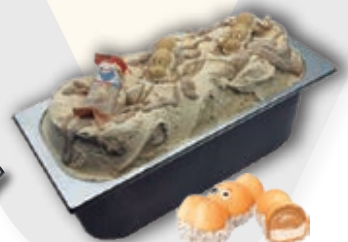
0726 Wafer Hippo 6 l.