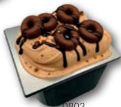
0802 Hecho con Donettes 2,8 l.