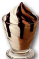
Copa Hostelería Café Latte 180 ml