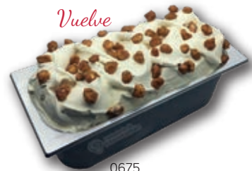
0675 Vainilla Tahití con Nueces de Macadamia