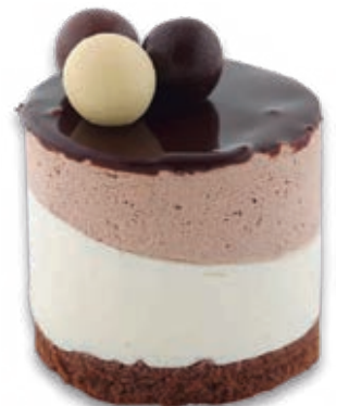
Tres chocolates 0382

Mousse de crema tostada, galleta Lotus, decorada con una mezcla de dos chocolates. 130 ml. 12 unidades/caja.