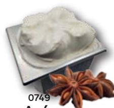
0749 Anís Estrellado