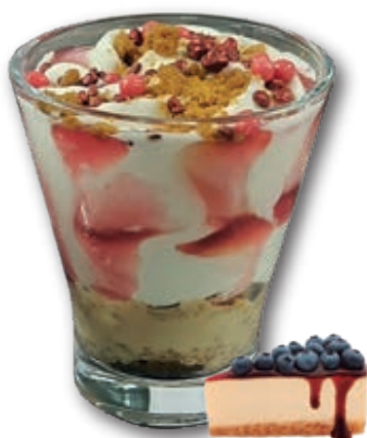
0112 Tarta de Queso con arándanos

Una distinguida copa de cristal y el mejor helado Premium, con una irresistible mezcla de salsas, galletas y toppings.