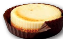
Tartita Individual Queso Fundente 150 g. 9 Unidades