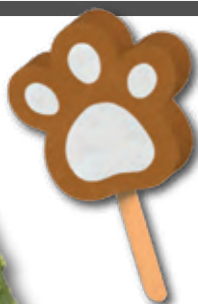
0029 Polo Patrulla Canina