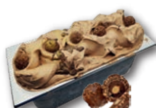
0619 Chocolate ROCHER