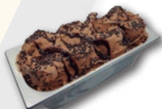
0713 Muerte por Chocolate