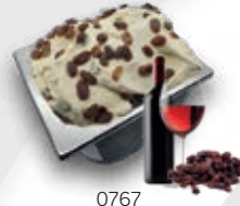
0767 Pedro Ximénez con Pasas