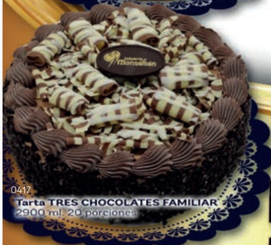
0417 Tarta TRES CHOCOLATES FAMILIAR 2900 ml. 20 porciones