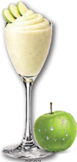
0507 Manzana Verde

Deliciosos sorbetes líquidos ya preparados, listos para descongelar y servir. Especiales para banquetes y catering.