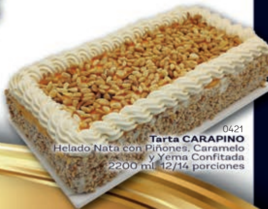
0421 Tarta CARAPINO Helado Nata con Piñones, Caramelo y Yema Confitada 2200 ml. 12/14 porciones