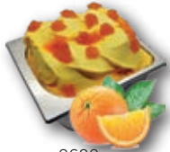
0680 Naranja Crema