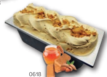
0618 Turrón Suprema