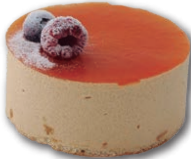
Tartín de Turrón a la Naranja 0400 Mousse de turrón, bizcocho artesano con mermelada de naranja, con harina sin gluten y leche sin lactosa. 170 ml. 12 unidades/caja.