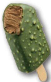
Bombón Luxxus Dubai 16 Unidades