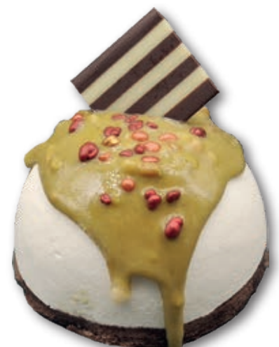
Iglú Chocolate Blanco con Pistacho 3123

Mousse de chocolate blanco con crema de pistacho. 150 ml. 12 unidades/caja.