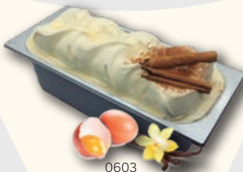
0603 Vainilla Mantecado