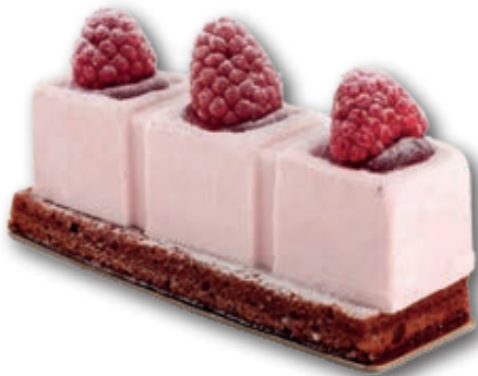
Lingote Yogurt con Frutos Rojos 0399 Bizcocho de chocolate, exquisito mousse de yogurt con frutos rojos, decorado con frambuesas. 130 ml. 15 unidades/caja.