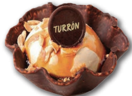
Turrón Suprema 0323 Auténtico helado de turrón y galleta bañada en chocolate. Decorada con almendras, turrón Jijona y medalla de chocolate. 140 ml. 12 unidades/caja.