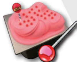
0803 Cherry Gum 2,8 l.