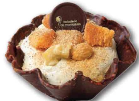
Gachas Artesanas 0310 Típico postre casero trasladado a un sabroso helado artesano y galleta bañada en chocolate. 140 ml. 12 unidades/caja.