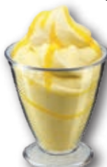
Copa Hostelería Limón con Limoncello 180 ml