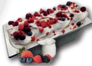
0632 Yogurt con frutas del bosque