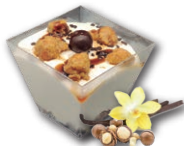
0339 Vainilla Tahití con Nueces de Macadamia