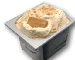
0769 Galleta Speculoos