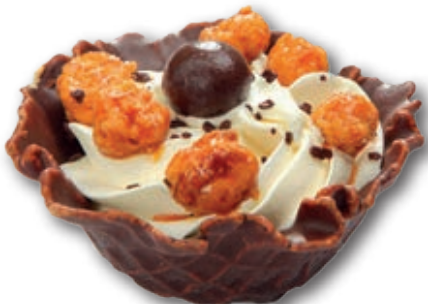
Vainilla Tahití con Nueces de Macadamia 0377 Exquisito helado de vainilla-tahití con seleccionadas nueces de Macadamia caramelizadas y galleta bañada en chocolate. 140 ml. 12 unidades/caja.

El Clásico postre con el mejor Helado Artesano