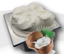
0677 Coco Crema