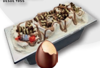
0639 Huevo Sorpresa Chocolate