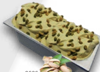
0636 Pistacho Oro