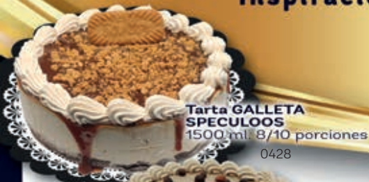
Tarta GALLETA SPECULOOS 1500 ml. 8/10 porciones 0428