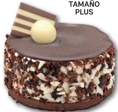
Capriccio Tres Chocolates 0333 Helado de chocolate con leche y chocolate blanco. Canteado con Pallieté y decorado con cubierta de chocolate, chocolatina y bola de cereal. 160 ml. 12 unidades/caja.