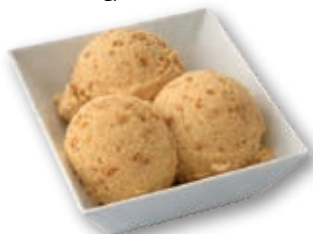
Bolas Artesanas Speculoos (Lotus)