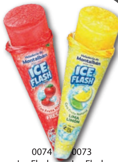
0074 Ice Flash Fresa