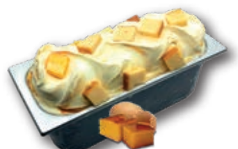
0782 Vainilla con Tocino de Cielo