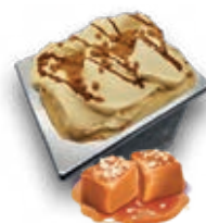
0765 Caramelo Salado a la Vainilla