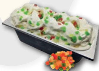
0613 Tutti Frutti