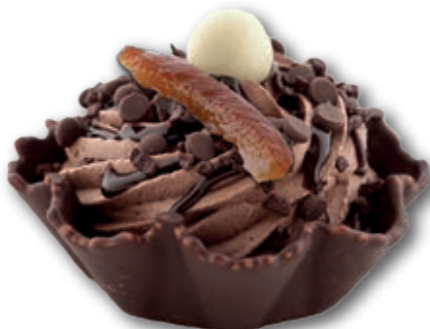
Muerte por Chocolate 0298 Intenso helado de chocolate 70% decorado con chocolate puro, naranja escarchada y bola de chocolate blanco. 140 ml. 12 unidades/caja.