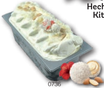
0736 Hecho con Raffaello