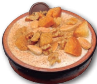
3060 Gachas Caseras 170 ml. 6 unidades/caja