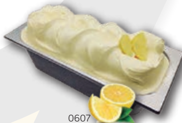
0607 Limón Crema