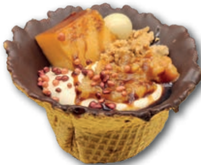
CREPPES NIDO MOUSSE TURRÓN CON TOCINO DE CIELO 9432 Mousse de turrón con tocino de cielo y crema de tocino de cielo sobre galleta creppe y chocolate. 125g. 12 unidades/caja