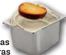
0770 Torrijas Caseras