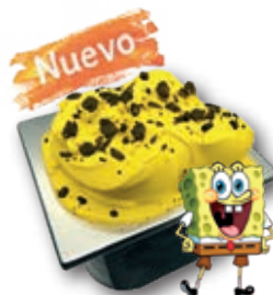
0801 Bob Esponja 2,8 l.