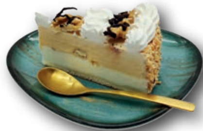
Tarta Nata Nueces con Toffee Porcionada Helado de nata, helado de nueces y nueces picadas 12 porciones/2100 ml.