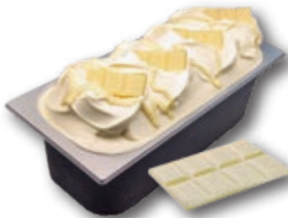
0772 Hecho con Chocolate Blanco Mikybar