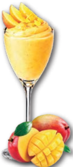
0503 Mango Tropical