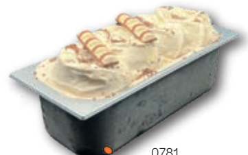
0781 KINDER Blanco