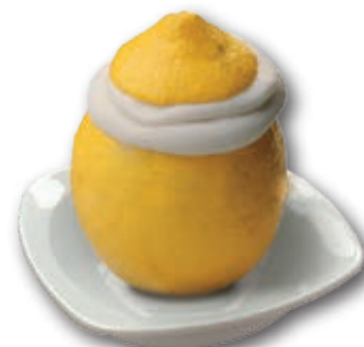
0309 Limón Helado 140 ml. 6 unidades/caja