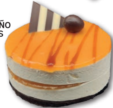
Tartín de Vainilla con Crema Brulée 3122 Mousse de vainilla con crema brulée 170 ml. 12 unidades/caja.