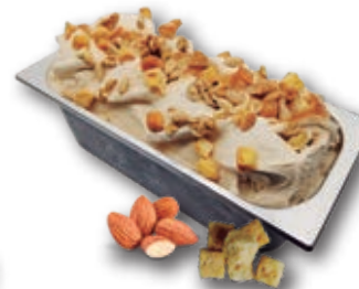
0615 Gachas Caseras