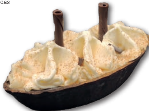
Vaporeto Crema Catalana 0313 Cremoso helado de crema catalana con una artística presentación. 130 ml. 12 unidades/caja.