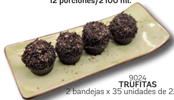
9024 TRUFITAS 2 bandejas x 35 unidades de 22 g. aprox.