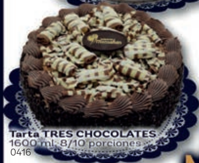
Tarta TRES CHOCOLATES 1600 ml. 8/10 porciones 0416