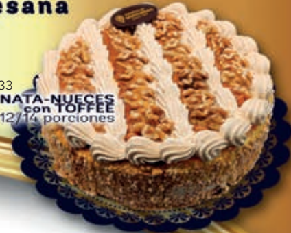
3133 Tarta NATA-NUECES con TOFFEE 2100 ml. 12/14 porciones