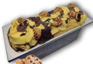
0751 Cookies Chips