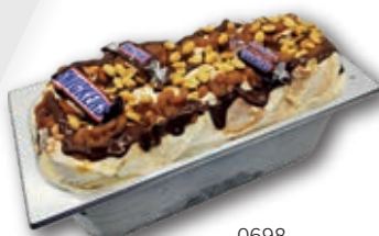
0698 Hecho con Snickers