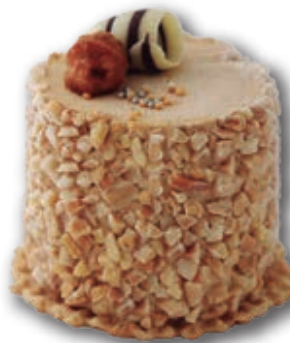
Crocantino 0308 Tradicional helado de vainilla y turrón. Canteado de crocanti. Decorado con nueces de Macadamia y viruta de chocolate. 130 ml. 14 unidades/caja.