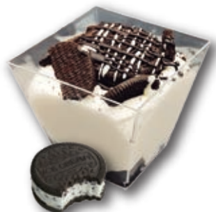
0338 Crema con Galleta Oreo