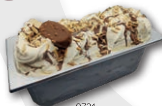
0731 Vainilla con Choco Almendra