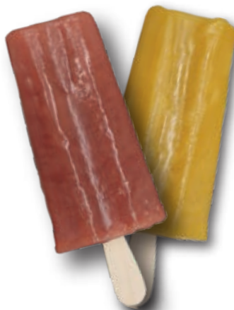
0075 Polo Frutos Rojos 30 Unid./caja.