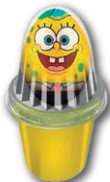
Huevo sorpresa Bob Esponja Helado de Vainilla. Huevo sorpresa de chocolate. 100 ml. 9 unid./caja 0169