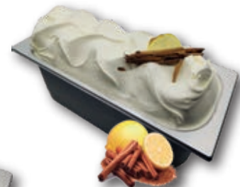
0610 Leche Merengada