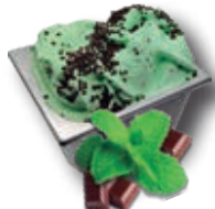
0768 Menta Chips