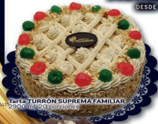
0411 Tarta TURRÓN SUPREMA FAMILIAR 2900 ml. 20 porciones