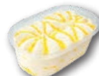
Vasito Menú Premium Limón 27 unidades