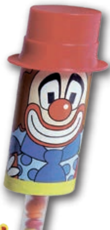
eómico Vainilla con Lacavitos 100 ml. 21 unid./caja 0254