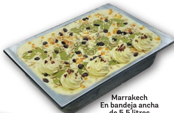
Marrakech En bandeja ancha de 5,5 litros