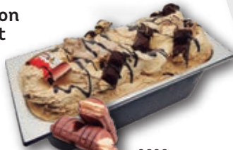
0626 KINDER Nocciola