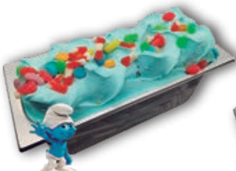
0609 Pitufo con Gominolas 6 l.