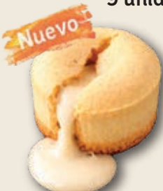
9466 Coulant Chocolate Blanco 18 unid./90 g.