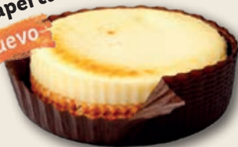
9434 Tartita Queso Fundente Individual 9 unid./150g.