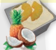
0775 Piña Colada