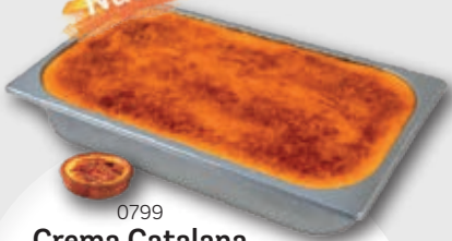
0799 Crema Catalana