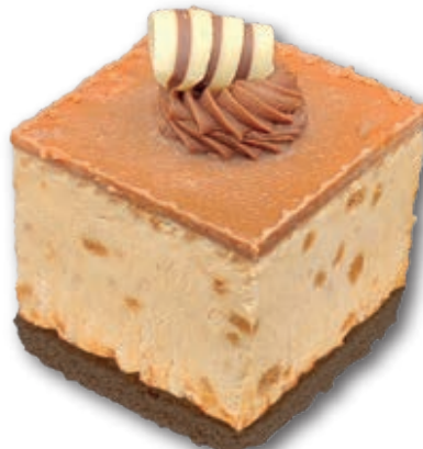
Semifrío con Galleta Lotus 3088

Mousse de tiramisú, bizcocho artesano, galleta negra y cacao coronado con chocolatina. 130 ml. 14 unidades/caja.