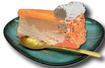
0424 Tarta Yema al Whisky Porcionada Helado de nata, avellana y Yema al Whisky 12 porciones/2100 ml.