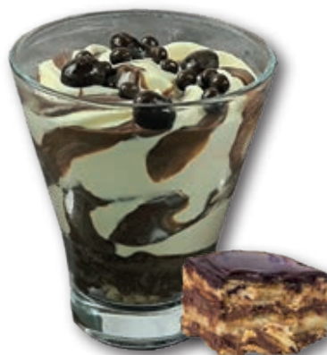
0111 Tarta de la Abuela