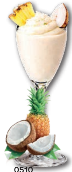
0510 Piña Colada