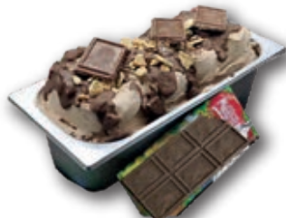
0760 Hecho con Chocolate Jungly