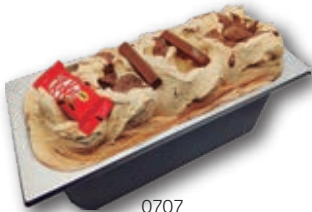
0707 Hecho con Kit Kat