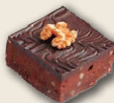
9026 Brownie Americano con Nueces 20 unid./100 g.