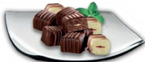
0256 Bomboncito Helado Helado de vainilla y cubierta de chocolate. 10x24 unidades. 20 ml.