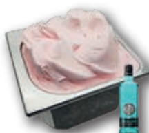
0714 Gin Puerto de Indias