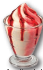
Copa Hostelería Nata Fresa con salsa de Frambuesa 180 ml